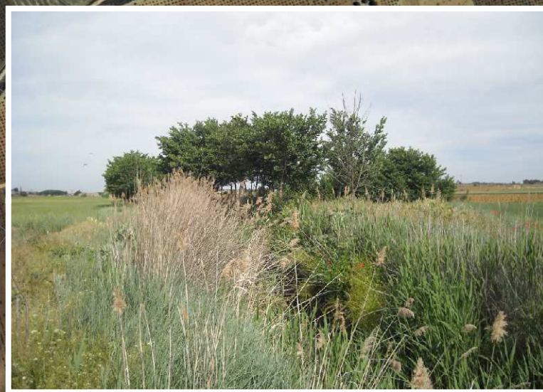
FOTO 3. Encajonamiento progresivo del cauce